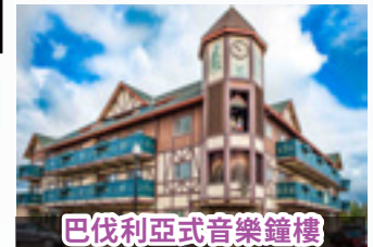
巴伐利亞式音樂鐘樓